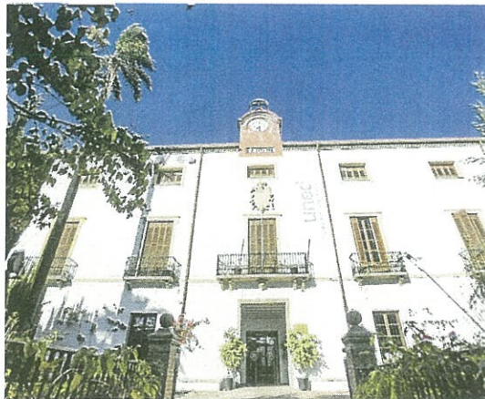
Fachada de la UNED en la Costa. IDEAL

NO ESTÁS SOLO Nada más iniciar el curso los alumnos disponen de un Plan de Acogida que les ayudará en sus primeros pasos. Con materiales didácticos innovadores y de calidad y con